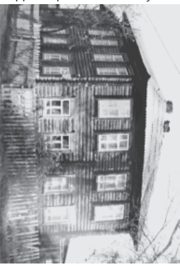
Дом первого жителя Шумихи